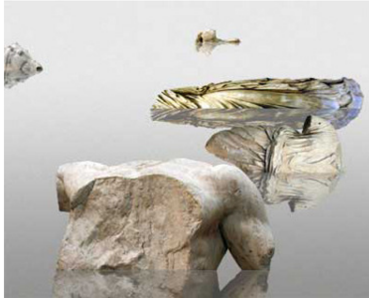
Gun Holmström, Arkipelag , 2008. DVD, kesto 6 min 30 sek.

Arkipelag -animaatiossa lipuvat torsot muodostavat saariston. Liikkuuko kamera vai liikkuvatko saaret? Minun silmissäni ne liikkuvat kuvaruudussa oikealle. Torsot heijastuvat keinotekoiseen veteen, jossa niistä muodostuu kokonaisuus, vaikkakin keskeltä katkaistu kuten veistoskuviissa.